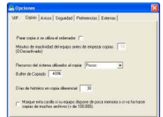
Opciones de Configuración